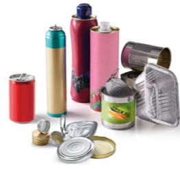
Les boîtes de conserve, bidons de sirop, canettes, aérosols, barquettes alu, couvercles métalliques