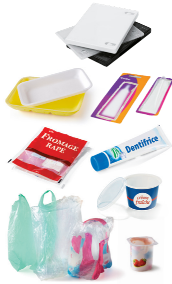
Tous les emballages en plastique : sacs, sachets, films, barquettes alimentaires, pots, tubes...