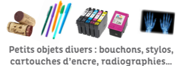
Petits objets divers : bouchons, stylos, cartouches d'encre, radiographies...