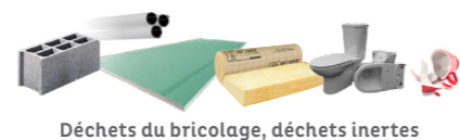
Déchets du bricolage, déchets inertes