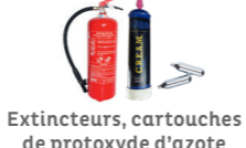
Extincteurs, cartouches de protoxyde d'azote