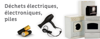
Déchets électriques, électroniques, piles