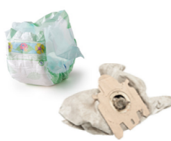
Les couches, sacs d'aspirateur