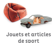
Jouets et articles de sport