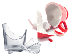
Petits objets cassés hors emballage