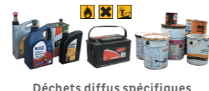
Déchets diffus spécifiques