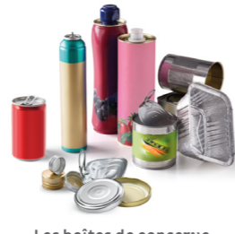
Les boîtes de conserve, bidons de sirop, canettes, aérosols, barquettes alu, couvercles métalliques