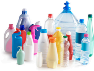
Les bouteilles et flacons en plastique