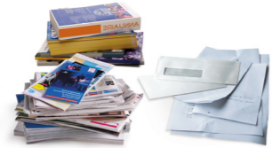
Tous les papiers, journaux, magazines