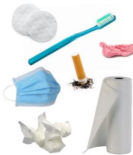
Les ordures ménagères