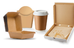
Les emballages de fast food