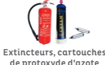
Extincteurs, cartouches de protoxyde d'azote