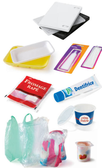
Tous les emballages en plastique : sacs, sachets, films, barquettes alimentaires, pots, tubes...