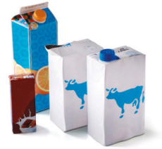
Les briques alimentaires (de lait, crème, soupe, jus de fruits...)

➤ En urac, sans sac ➤ Bien vidés ➤ Non rincés ➤ Non emboîtés