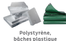
Polystyrène, bâches plastique