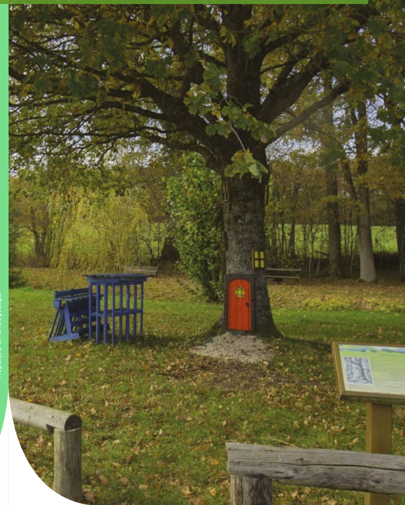
Ne pas jeter sur la voie publique